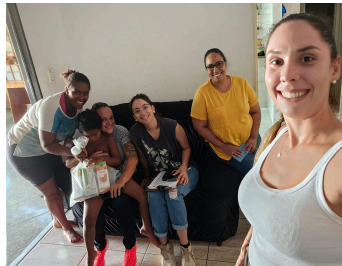
Visita Domiciliar 17/01