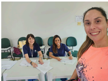
Eleição CMPCD 22/01