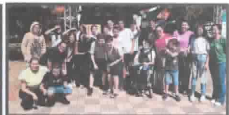
Lista de presença Santa Rosa de Viterbo