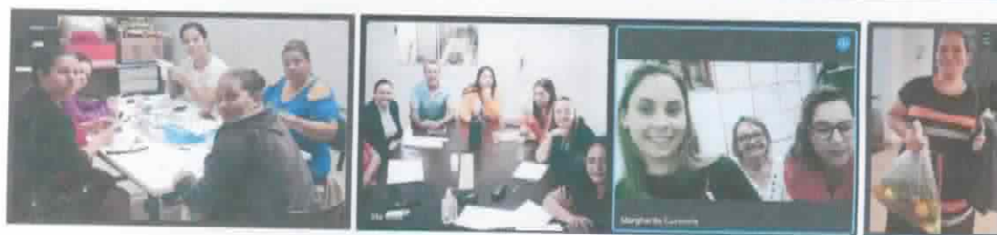
Momentos especiais no Buffet Passatempo