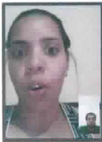
Família do educando E.D. Videochamada 19/01/2024