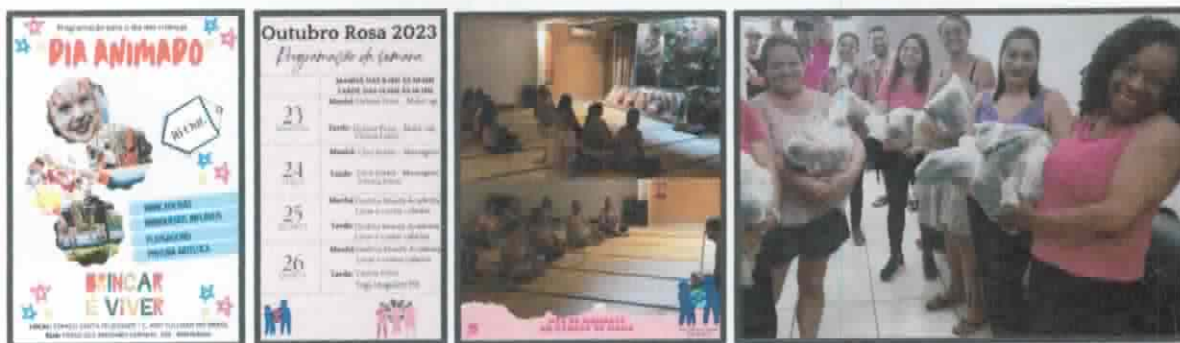
Lista de presença Santa Rosa de Viterbo

5 - Projeto: É preciso saber viver "Outubro Rosa"