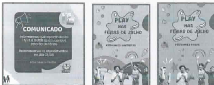
Lista de presença Pontal