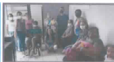
Lista de presença Santa Rosa de Viterbo