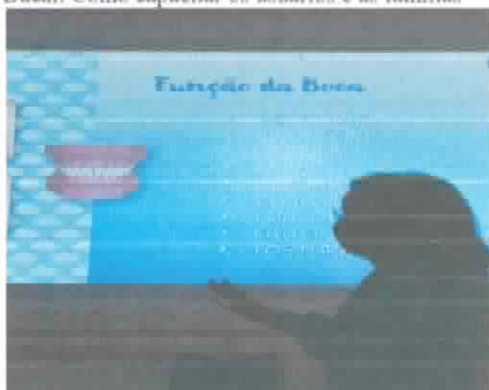
Apresentação no Programa Escola na TV

Palestra educativa para os professores do CASB-RP : Saúde Bucal: Como capacitar os usuários e as famílias