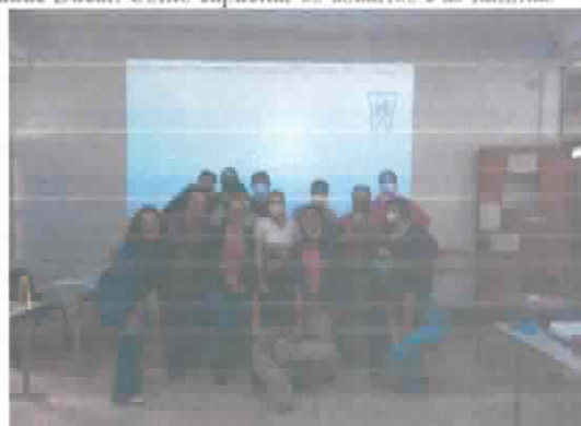
Apresentação no Programa Escola na TV

Palestra educativa para os professores do CASB-RP : Saúde Bucal: Como capacitar os usuários e as famílias