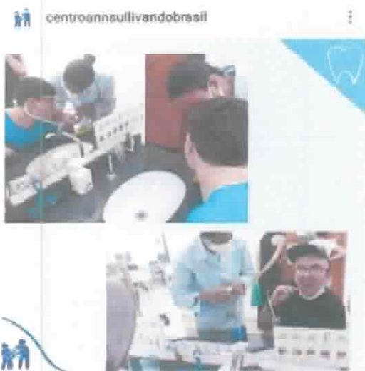
Atividade de Vida Diária