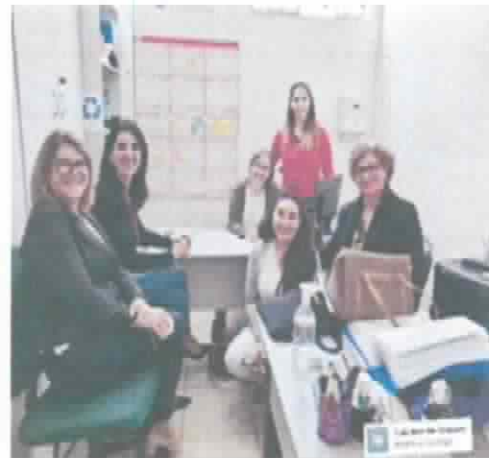
Reunião DPSE – 30/08/2022