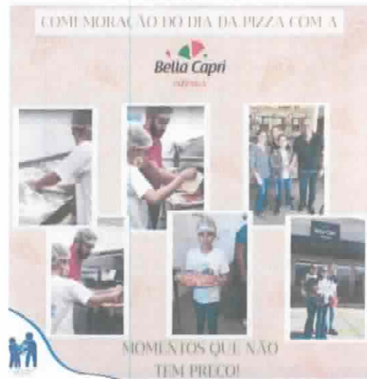
Evento Social – Comemoração Dia Pizza 07/07/2022