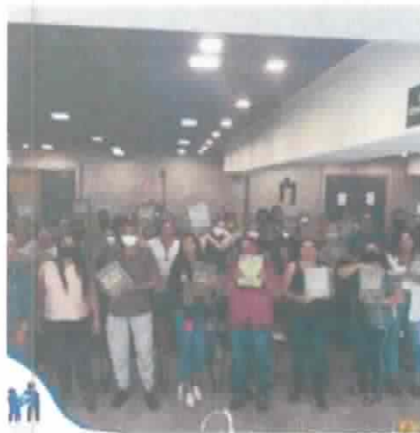
Oficina Mesa Brasil "O que tem na geladeira"