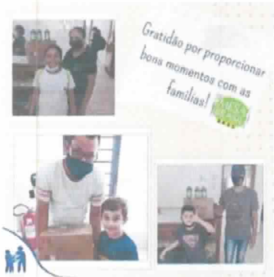
Doações de Cesta Básica - Agosto