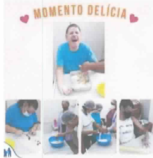
Atividade de Culinária "Preparo do Proprio Lanche"