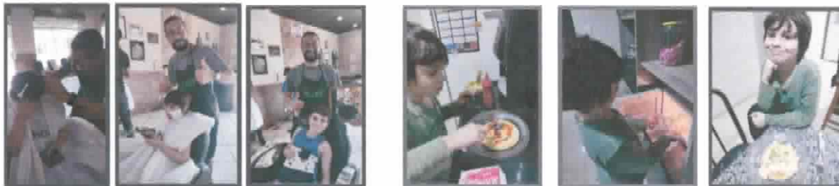
YM: Cortando cabelo e usando máscara