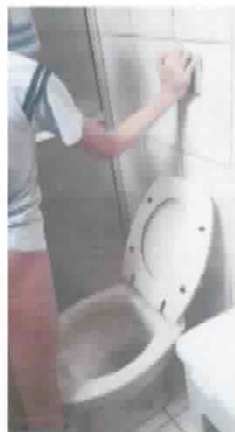
Mãe inicia o auxílio verbal para que usuário deixe as fraldas 04/06/2020