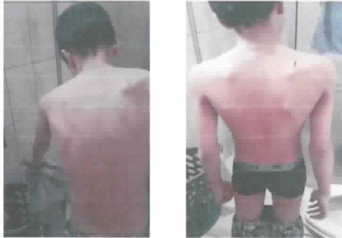
Usuário recebe auxílio verbal da mãe e retira sua roupa colocando-a no cesto. 02/06/2020

intervir no desenvolvimento do usuário. Obtivemos uma boa aceitação dessas orientações pelos pais, e um retorno positivo, mostrado nas fotos que se seguem enviadas pelos pais.