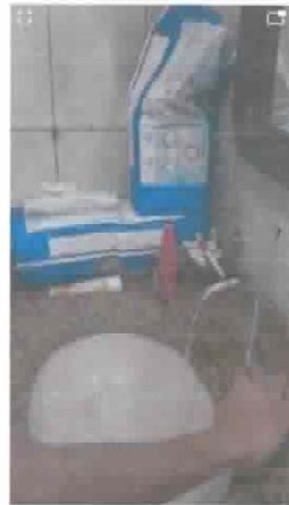
Após o xixi, usuário lava suas mãos, também com auxílio verbal 04/06/2020